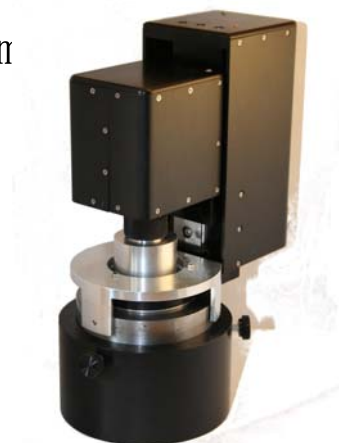
自动穿衬套扫描器BSH 1.5