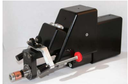
自动穿衬套扫描器 BSH 0.5